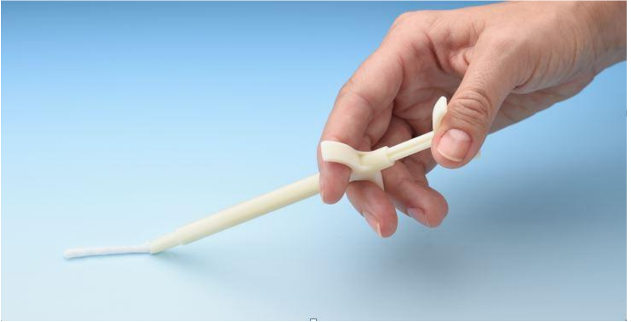
Kuva 1.